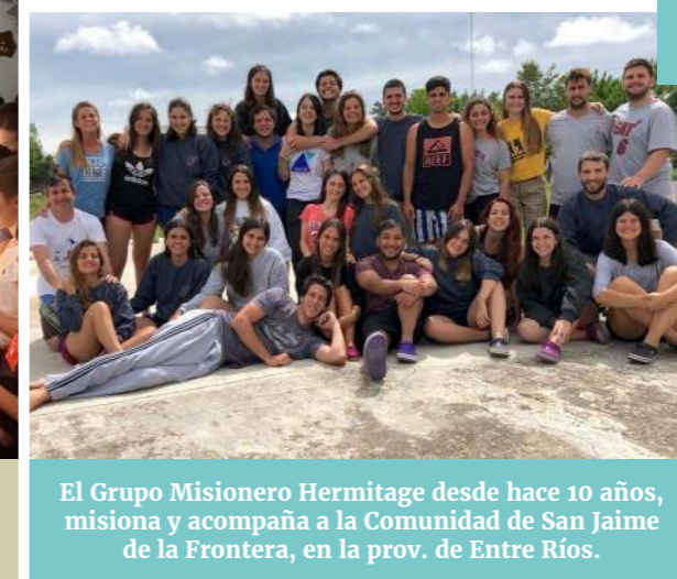
El Grupo Misionero Hermitage desde hace 10 años, misiona y acompaña a la Comunidad de San Jaime de la Frontera, en la prov. de Entre Ríos.

Retiro "PARTIR": Durante dos días, compartimos, reflexionamos y nos acercamos un poco más a Jesús."