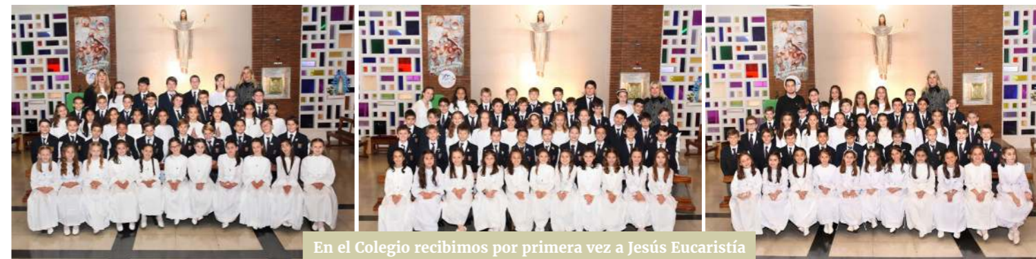
En el Colegio recibimos por primera vez a Jesús Eucaristía