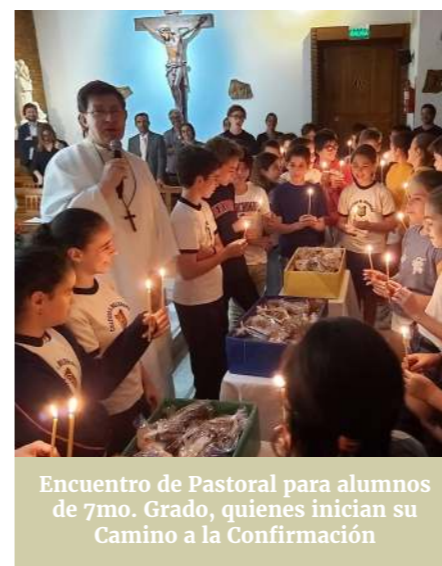
Encuentro de Pastoral para alumnos de 7mo. Grado, quienes inician su Camino a la Confirmación